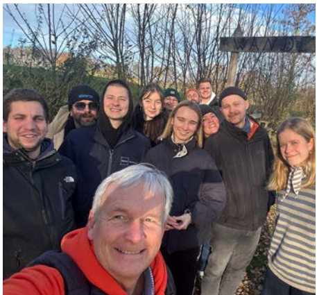
Vorsitzender KJR SL-FL e.V.